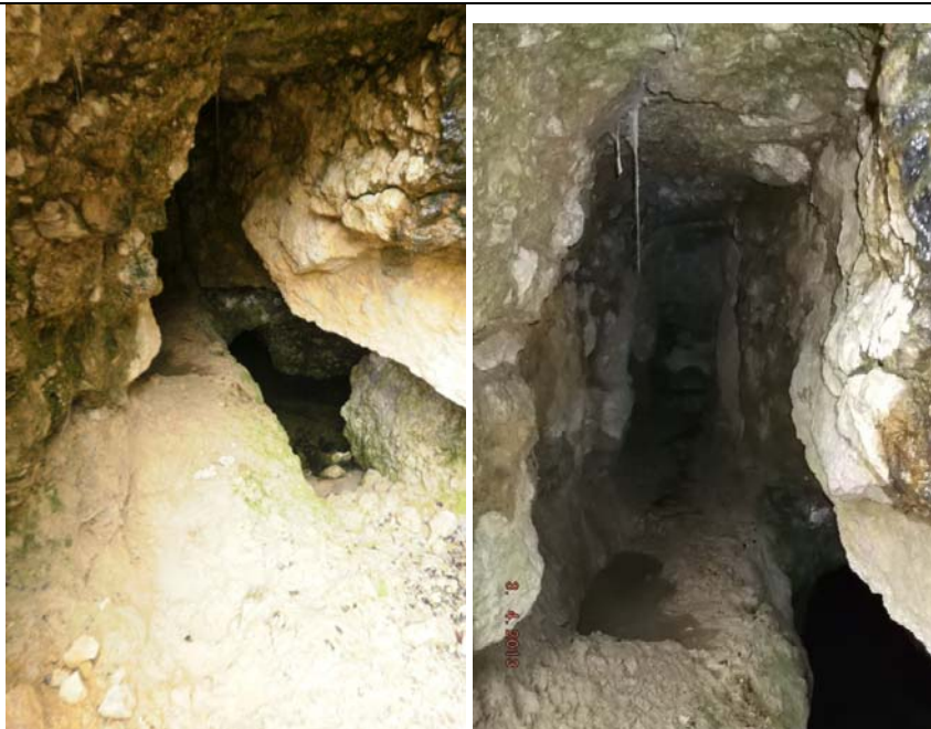
Fuente del Fondista 3. Tollo en el barranco junto a la fuente (03-04-2013)