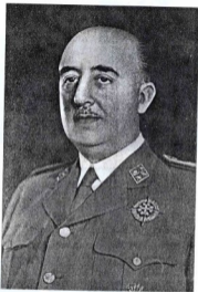
Francisco Franco Bahamonde