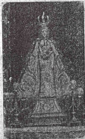
Maria Santisima de Belén

QUE LA MUY NOBLE, MUY LEAL Y FELICISIMA CIUDAD DE ALMANSA Celebra en honor de su Excelesa Patrona