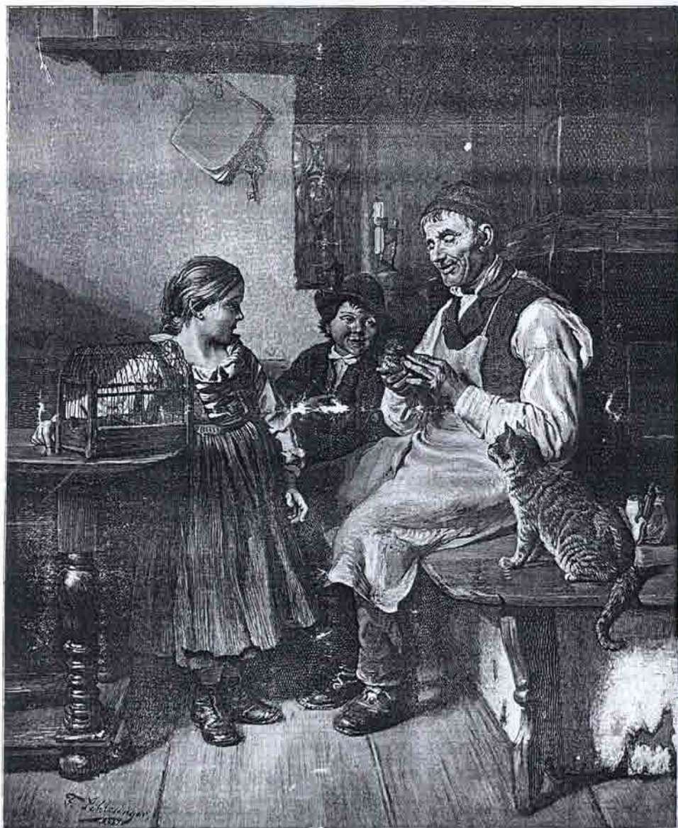
El cazador de pájaros.