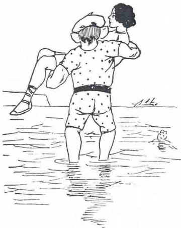
Uno de los que se cargan más gente en el verano.