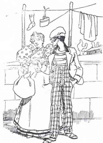
—Mira, tú, los baños son iguales. Na más las duchas se echan el agua por la cabeza, y en bio los baños de asiento...