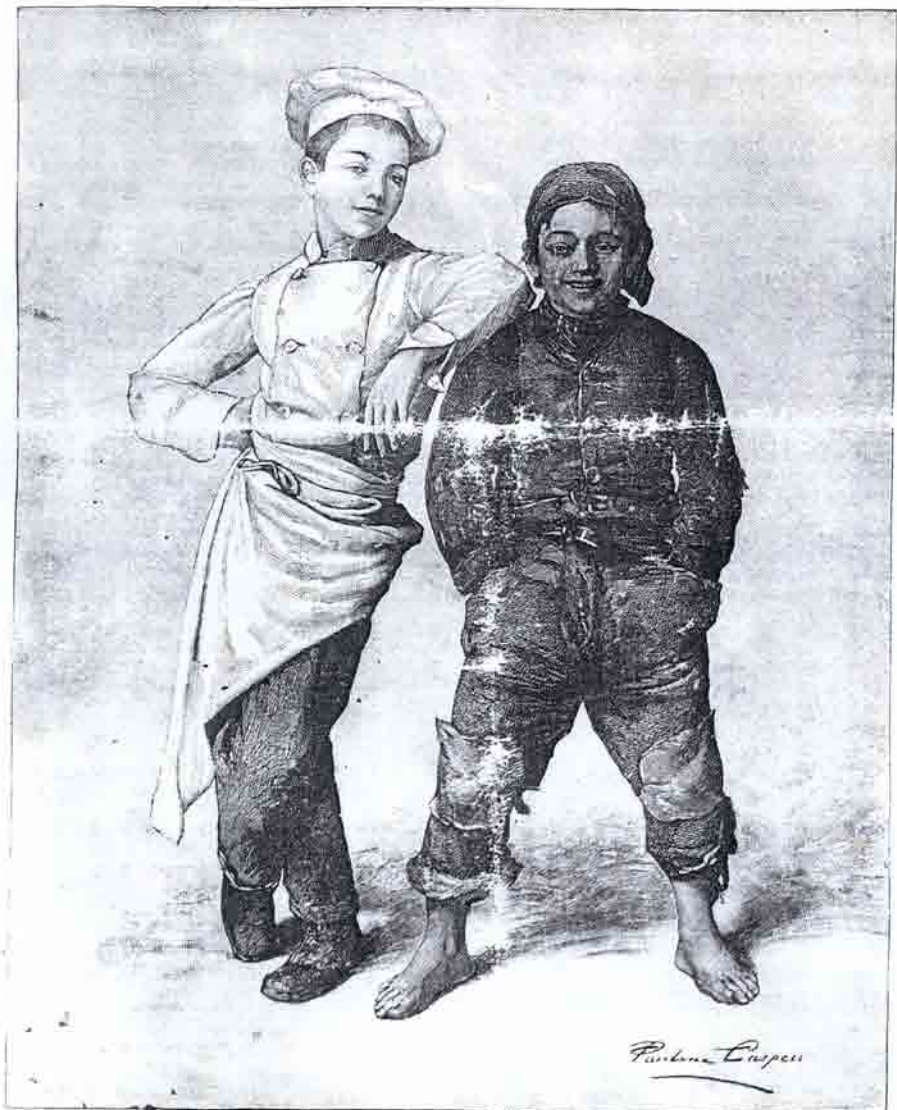
BLANCO Y NEGRO (Cuadro - Fernando Caspary).